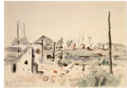
入門編 左：《木陰》、応用編 右上：《窓辺（海）》、右下：《蘇州》1938年