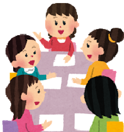
第7期 小金井市地域自立支援協議会委員