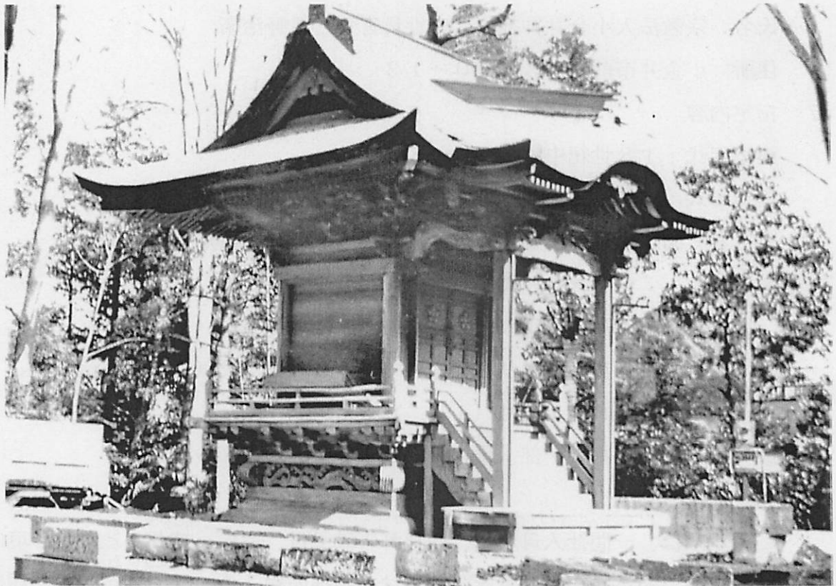
小金井神社本殿 全景（平成5年覆屋新築工事時）