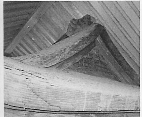
柿葺・入母屋屋根の妻飾