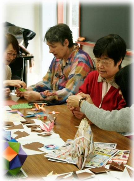
ふろしき おす 風呂敷・ひもの結び