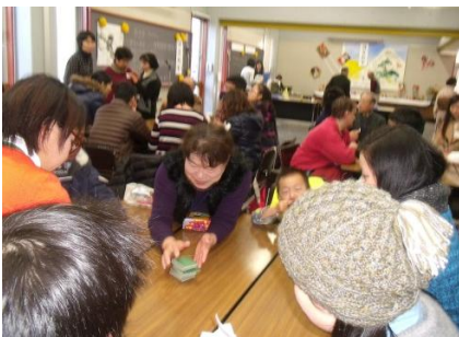
ぐるーぷ わ 分けられて 競争 グループに分かれて競技