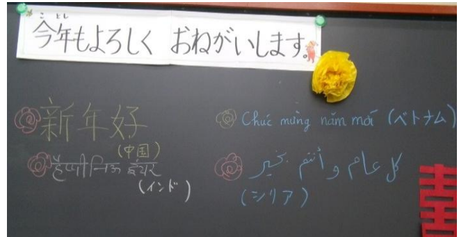
かんじ 漢字 なーがりーもじ ナーガリー文字