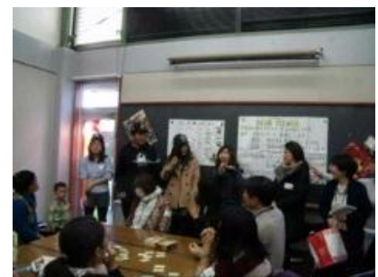
ゆうしょうしゃ ほうび 優勝者にご褒美