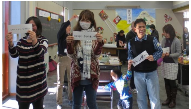
わたし なに さが 私は何を探すの？