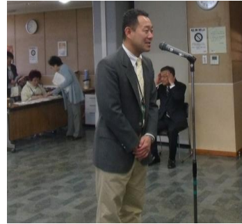
わかふじぶんかんちやう 若藤分館長