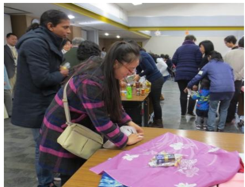
ふろしき つつ 風呂敷に包みましょう