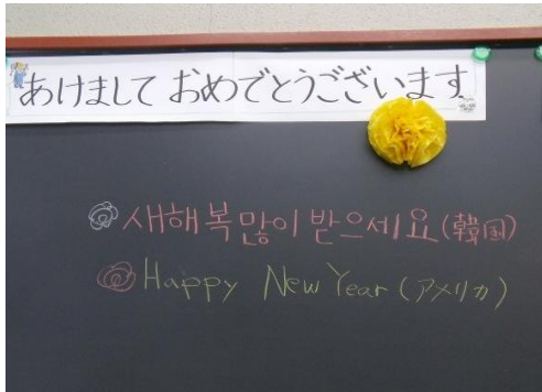
はんぐるもじ ハングル文字 ろーまじ ローマ字

ろっかこく かんこく あめりか ちゆうこく いんど ベとなむ しりあ しゅつしん がくしゅうしゃ 六か国 (韓国、アメリカ、中国、インド、ベトナム、シリア) 出身の学習者にそ れぞれの言葉で新年のあいさつを書いてもらったところ、なんと六種類の異なる文字 が書かれました。