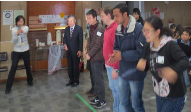
いち 位置について