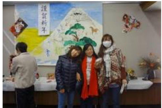
しょうがつかざり まえ 正月飾りを前に