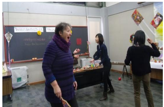
はね (手前) てだま (奥) 羽根つき (手前) お手玉 (奥)