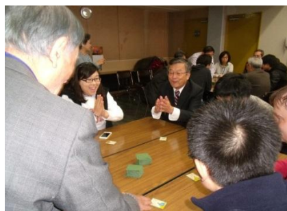
しちやう さんか 市長も参加