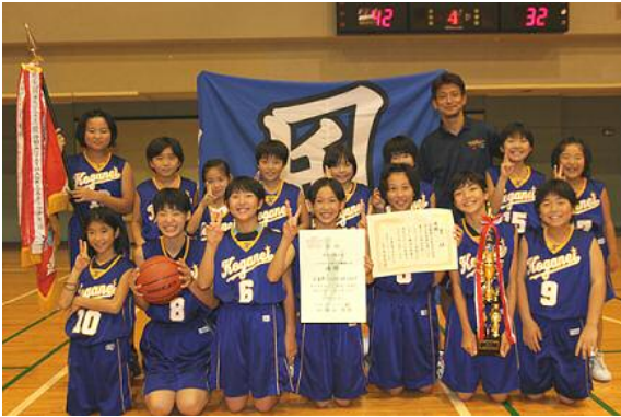
第35回東京都ミニバスケットボール大会優勝 (女子の部)

取材を行うため、既に暗くなった東小学校に近づくと体育館の窓から煌々と明かりがもれていて、更に近づくと子どもたちの元気な声の中から聞こえてきました。