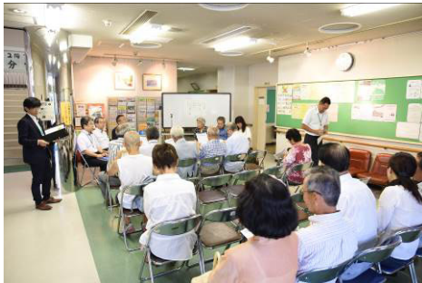
8月1日のセレモニーの様子

8月からNPO法人に事業運営を委託しました。 今後も、市民協働の公民館をご利用ください。