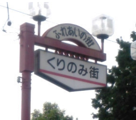
新小金井駅南口にある通称「くりのみ街」