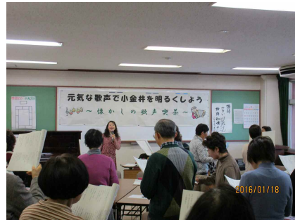
前回の講座の様子