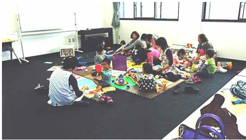
講座中 保育の様子

現在活動中のサポーター約30名は全員女性ですが、次の講座では男性の参加も大歓迎です。