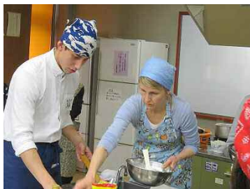
フィンランドの料理 調理実習の様子

平成28年度は、フィンランドの民族楽器演奏、歴史と文化を学び、フィンランドの家庭料理を作りました。