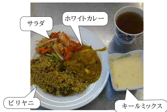
バングラデシュ料理

平成30年度1回目は、バングラデシュについて行いました。12月に実施し、国の紹介と料理を作りました。