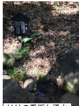
はげの看板と湧水

雨が降っている時には、この雨が湧水になり循環しているということを思い出し、滄浪泉園を散歩してみたいかがでしょうか？