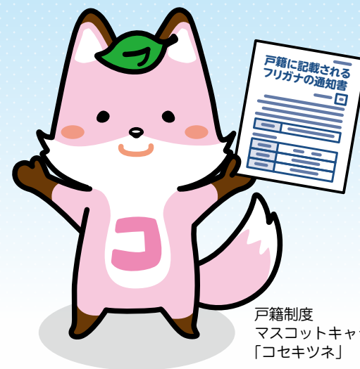
戸籍制度 マスコットキャラクター 「コセキツネ」