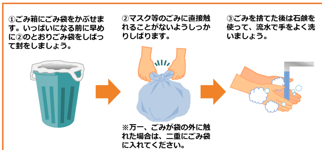
図1 新型コロナウイルス等の感染症の感染者又はその疑いのある方の使用済みマスク等の捨て方(環境省)