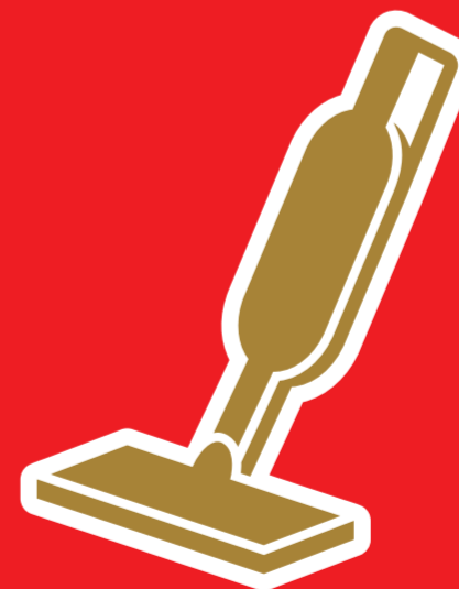
ハンディクリーナー