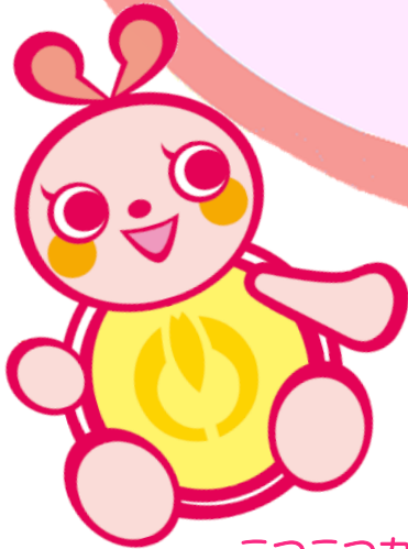
こつこつカメちゃん