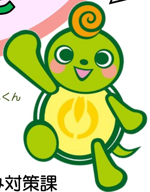
くるくるカメくん