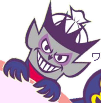
ムダガベッジ將軍