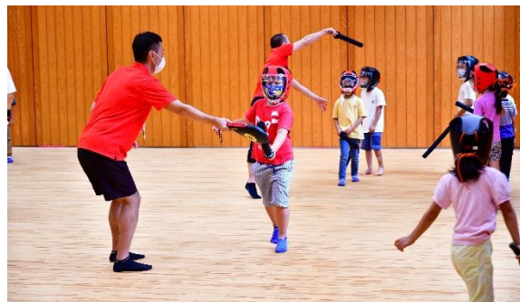
【スポーツチャンバラ】

今回は事前応募での開催でしたが、久しぶりのスポーツのお祭りを、私たち指導員も参加者と一緒に楽しむことができました。