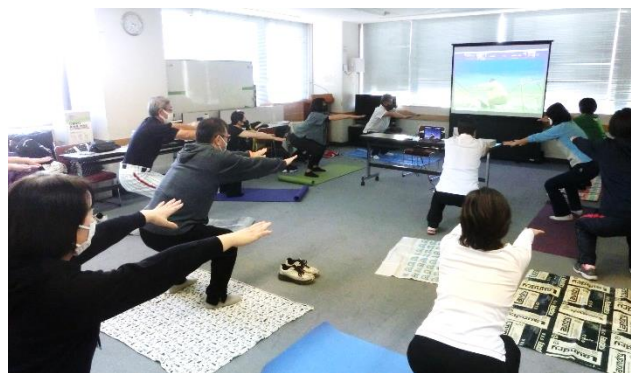
【フレイル予防のための筋カトレーニング】

今年度の研修会(主催:三鷹市)は、リモート開催となりました。研修では、正しいストレッチとフレイルについて学びました。