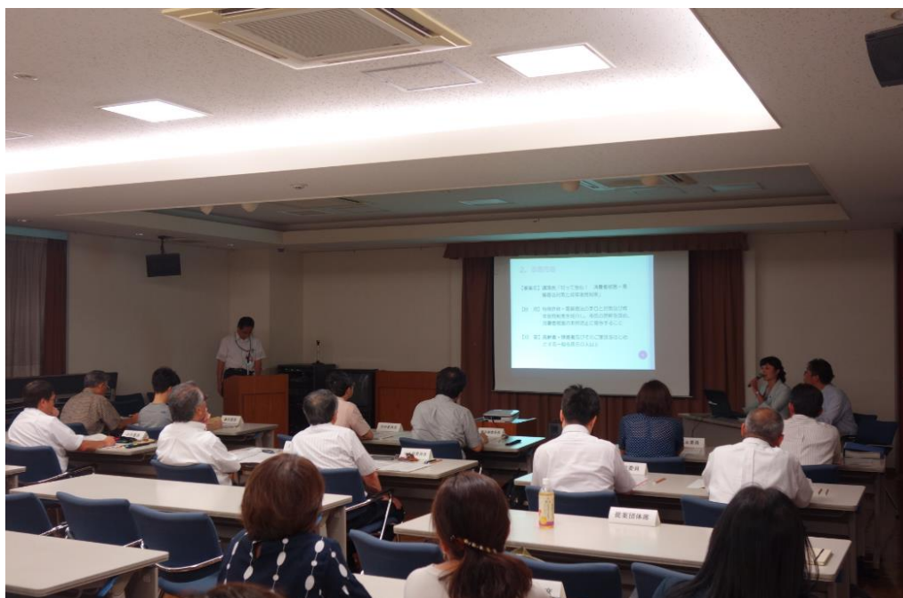
プレゼンテーションの様子

※なお、新型コロナウイルス感染症の感染拡大防止のため、令和3年度実施事業の第2次審査はビデオ審査を実施しました。令和4年度実施事業についても状況により同様の可能性がありますのでご了承ください。