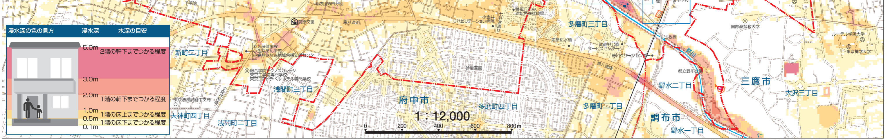
この地図の作成に当たっては、国土地理院長の承認を得て、同院発行の数値地図(国土基本情報)電子国土基本図(地図情報)及び数値地図(国土基本情報)電子国土基本図(地名情報)を使用した。(測量法に基づく国土地理院長承認(使用)R2JHs 224)