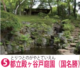
⑤ 都立殿ヶ谷戸庭園 (国名勝)

環境省名水百選に選ばれた真姿の池などからなる湧水群で、水路に沿って遊歩道がある。道の名は尾張徳川家のお鷹場に由来する。 国分寺駅の南に隣接する和洋折衷の回遊式林泉庭園。園内には湧水があり、野川の水源の一つ。