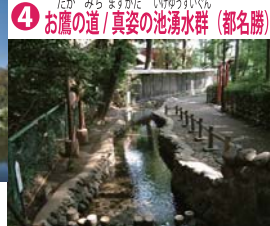
④ お鷹の道 / 真姿の池湧水群 (都名勝)

環境省名水百選に選ばれた真姿の池などからなる湧水群で、水路に沿って遊歩道がある。道の名は尾張徳川家のお鷹場に由来する。 国分寺駅の南に隣接する和洋折衷の回遊式林泉庭園。園内には湧水があり、野川の水源の一つ。