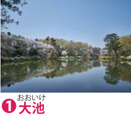
① おおいけ 大池

ゆゆうすいち湧水地 東京都の名湧水 57 選 野川流域には、源流部から下流部まで数多くの湧水地がある。そこで湧き出した水が集まり、野川として流れる。 野川の源流の一つとなっている湧水地で、深閑とした森に囲まれている。日立中央研究所内にあり、年2回一般公開される。