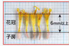
中心部の小花(筒状花)

小花が集まった頭状花で、直径は5～7cm。花びら(舌状花)はオレンジ色で、先は不規則に分かれます。八重咲きの品種もあります。