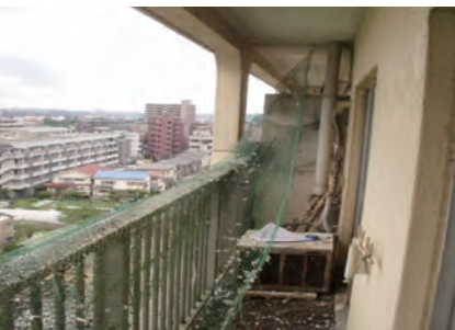
▲マンションベランダのよごれ