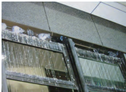
▲ビルの窓のよごれ