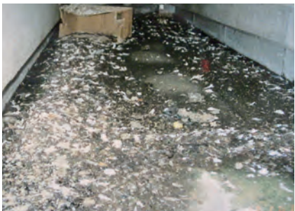
▲アパート通路のよごれ