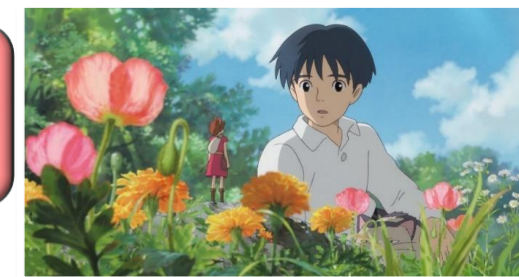
中段の左右のイラストは、(株)スタジオジブリが提供する場面イラストを使用しているよ。