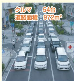
作成:松本市ノーマイカーデー推進市民会議、松本市、一般社団法人カーフリーデージャパン

※70人が各々移動するのに必要な台数と道路面積 ※自動車平均乗車数は1.3人で計算 ※CFDJ資料