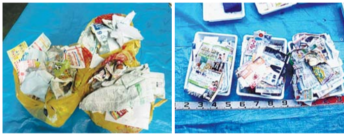
収集されたごみの一部

市民の皆さんにはごみの減量・資源化の推進にご理解・ご協力をいただいているところですが、燃やすごみの中にはまだまだ資源となる紙が混ざっています。