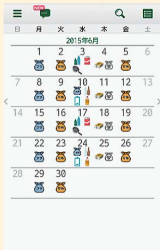
収集日カレンダー