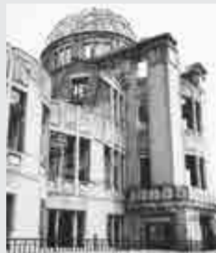
原爆ドーム(広島市)