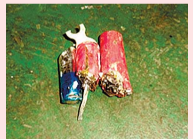
処理中に発火した乾電池