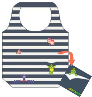
内ポケット収納タイプ（ボーダー） 縦38cm×横48cm×マチ16cm 販売価格 1,400円（税込）