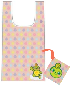
内ポケット収納タイプ（ピンク） 縦36cm×横28cm×マチ14cm 販売価格 1,200円（税込）