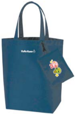
収納ポーチ付タイプ 縦43cm×横42cm×マチ13cm 販売価格 1,000円（税込）