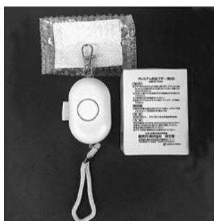
防犯ブザー (小学生用)

■配布市立小・中学校の新1年生は各学校で(申し込み不要)、市立小・中学校以外の新1年生は、学務課(市役所第二庁舎7階)で無料(電池交換等実費) ■4月6日から、直接、学務課学務係(☎042-387-9874)へ