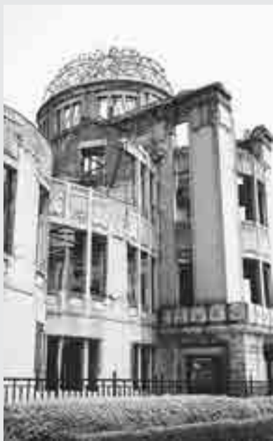
原爆ドーム(広島市)