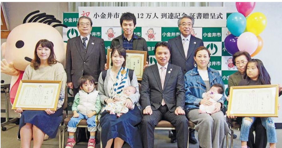
出席されたご家族と市長(前列中央)など