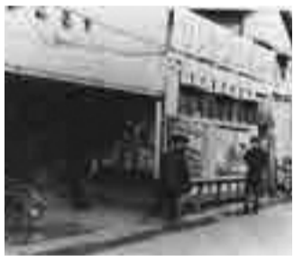
農工大通りにあった映画館(セントラル劇場)

申3月1日〜12日に、電話で市観光まちおこし協会(☎042-316-3980)へ