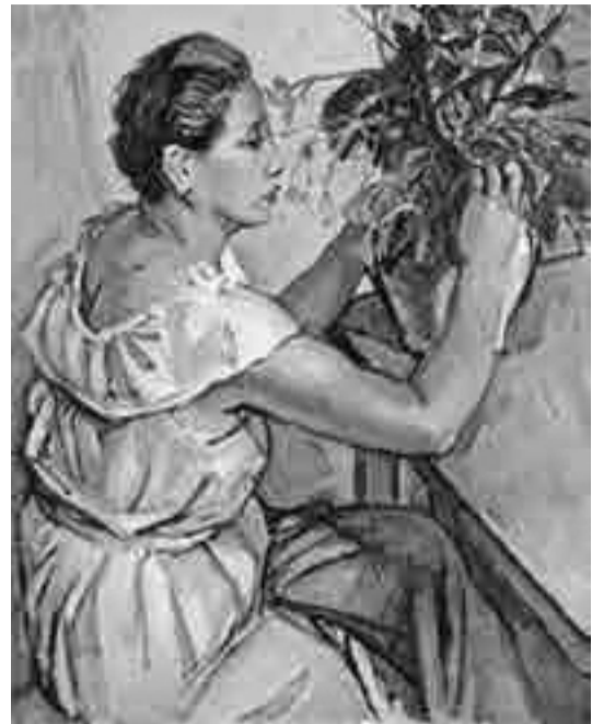
花を生ける(1963年、油彩・カンヴァス)