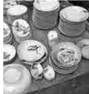
冠婚葬祭用の陶磁器