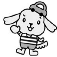
ちよこつと共済 マスコットキャラクター 「ちよこ助」

■加入申込書に会費を添えて市内の銀行等窓口(郵便局、三井住友信託銀行は除く)へ ■交通対策課交通対策係(☎042-387-9850)