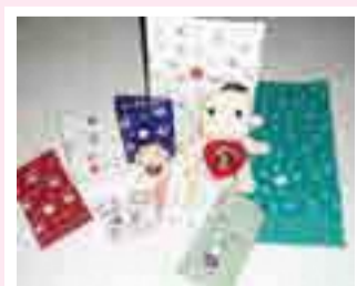
こきんちゃんグッズ購入者限定です!