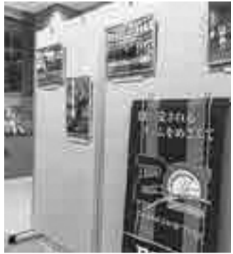
第4回写真展の様子

シーズン関連グッズ展示等 生涯学習課スポーツ振興 係(☎042-386-2462)