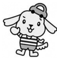
ちょこっと共済 マスコットキャラクター 「ちょこ助」

担によってAコースへの移行も可能) ■加入申込書に会費を添えて市内の銀行等窓口(郵便局、三井住友信託銀行は除く)へ ■交通対策課交通対策係 ☎ 042-387-9850