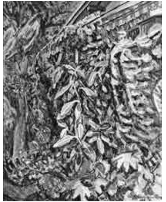
夏の家(1964年、油彩・カンヴァス)