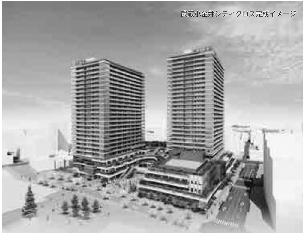
武蔵小金井シティクロス完成イメージ

03133348185309 他▽特別料金の適用は最長1か月まで▽広告掲出に当たっては、事前に審査があります ☎(株)京王エージェンシー(☎042-333-8530)