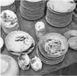
冠婚葬祭用の陶磁器

等)のスタッフ 対おおむね15～70歳の市内在住・在勤・在学の方 定10人程度 他詳細は別途連絡します 申3月15日(消印有効)までに、Eメールまたははがきで「桜まつりボランティア希望」・住所・氏名・年齢・電話番号を明記し、観光まちおこし協会(T184-0004本町6-5-3シャトー小金井1階 ☎042-316-3980) 三井 f.o.koganei@kanko.jp)へ