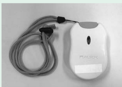
無線発報器（ペンダント式）