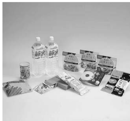
保存食5年セレクトセット