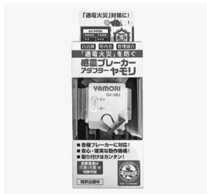
感震ブレーカーアダプター