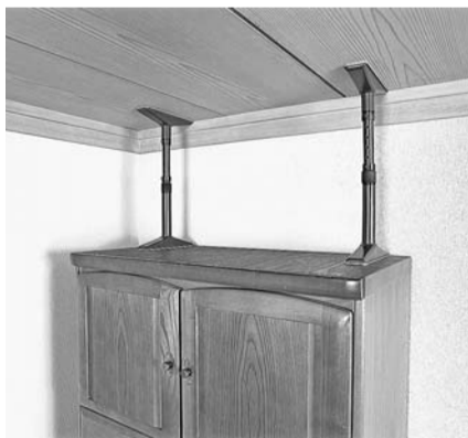
家具転倒防止器具