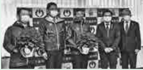
令和2年11月27日の寄贈式の様子

地域の農を身近に感じてもらう花育事業の一環として、市立小学校9校の全クラスに市内産ポインセチアの鉢花をいただきました。