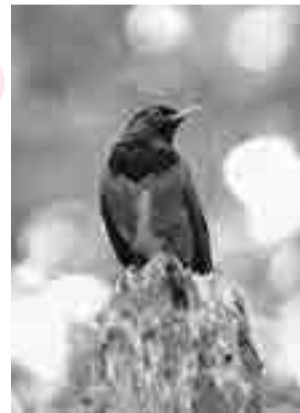
三宅島の鳥 アカコッコ

関 三宅島自然ふれあいセンター・アカコッコ館(☎04994-6-0410 関 http://www.wbsj.org/sanctuary/miyake/)