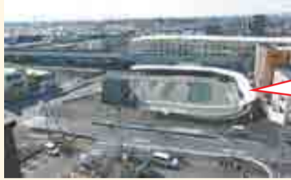
▲東小金井駅北口交通広場

令和元年に多摩産材を外装に用いたバスシェルターを設置しました。今後、周辺道路の整備に併せ、歩道舗装や案内板、ベンチなどの設置に向けての検討を進めていきます。