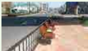
▲緑中央通り (中央線南側より以北を望む)