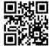
動画はこちらから