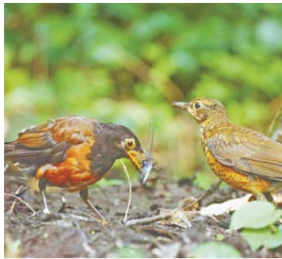
三宅島の鳥 アカコッコ

毎年野鳥たちのさえずりにぎわうこの季節に、バードアイランドフェスティバルを開催しています。期間中は、初めての人でもバードウォッチングを楽しめるイベントや野鳥のイラスト展など、楽しいイベントが盛りだくさん。バードウォッチングベストシーズンの三宅島に足を運んでみませんか。