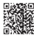
操作説明会について