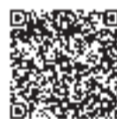
利用開始時期について

問公民館＝公民館事業係(☎042-383-1184)、スポーツ施設＝生涯学習課スポーツ振興係(☎042-386-2462)、集会施設＝コミュニティ文化課集会施設係(☎0422-30-0660)、公園施設＝環境政策課緑と公園係(☎042-387-9860)