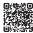
利用者登録について