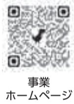
事業ホームページ

時 11月16日(水) 午後3時～4時30分 1 いけとおがわ、18日(金) 午後3時～4時30分 2 くじら山 所 いけとおがわ 東京学芸大学プレイパーク、くじら山 都立武蔵野公園 内 クイズラリー、しっぽ捕り競争、宝探しなど 対 小学生以上 他 持ち物等詳細は事業ホームページ ☎(https://www.kogan-ei-yu.net/playpark) をご覧ください 問 イベント内容について NPO法人こがねい子ども遊パーク ☎080-6880-9809 1 月曜・日曜日・休場日を除く 午前10時～午後5時、プレイパーク事業について 児童青少年課 児童青少年係 ☎042-387-9847