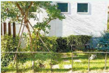
kazamidoriさん、通りに面した前庭