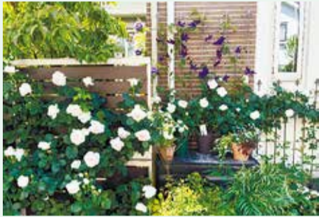
葉月さん、バラとクレマチスの競演