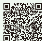
ジモティー 小金井市ページ

市では、粗大ごみからまだ使える家具等を市民の皆さんへ還元するリユース事業「ゆづる輪」を行っています。これは野川クリーンセンターへ搬入された粗大ごみから、再生可能な家具類の補修等を行い地域情報サイト「ジモティー」にリユース品を掲載し、無償譲渡を行う事業です。欲しい品物のお探しはもちろん、引っ越しが増えるこの時期にぜひご活用ください。事業の詳細は市公式ホームページ ( https://www.city.koganei.lg.jp/kurashi/446/sigenkatorikumi/reuse/riyu-sujigyoku.html )、掲載品はジモティー小金井市ページ ( https://jmt.y.jp/profiles/630d6a6c0d516100bdefade0 ) をご覧ください。