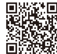
小金井 宮地楽器ホールホームページ

15日～5月15日に、小金井宮地楽器ホールホームページで問 同ホール(☎042-380-8099)