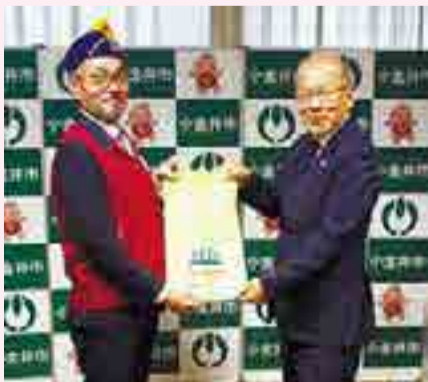
ライオンズクラブ河上会長と教育長