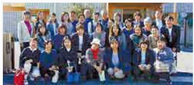
令和5年度秋季研修のようす