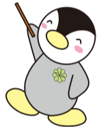
民生委員児童委員キャラクター ミンジー

※主任児童委員は区域の民生委員・児童委員と協力し、児童福祉に関する支援活動を行います