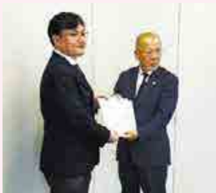
ロータリークラブ曾根会長と教育長