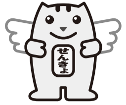
明るい選挙キャラクター 選挙のめいすいくん

任期満了(7月30日)に伴う東京都知事選挙は、6月20日に告示され、7月7日に投票が行われます。 貴重な一票を投票しましょう。