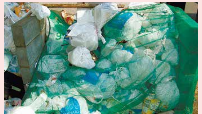
ルールが守られていないごみ集積所

集合住宅にお住まいの方でごみの出し方が分からないとき、またはごみ集積所を管理されている建物所有者および管理会社の方でごみ集積所の維持管理にお困りのときは、ごみ対策課へご相談ください。