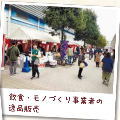
飲食・モノづくり事業者の逸品販売