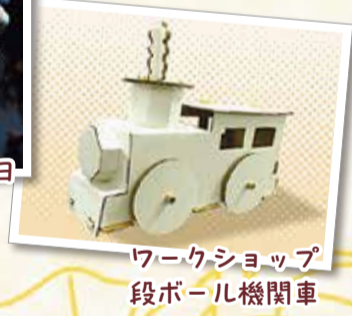
ワークショップ 段ボール機関車